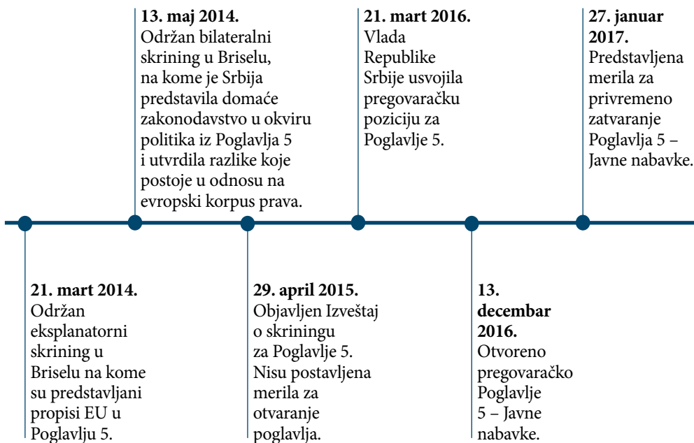
Grafikon 1: Hronologija pregovora o Poglavlju 5